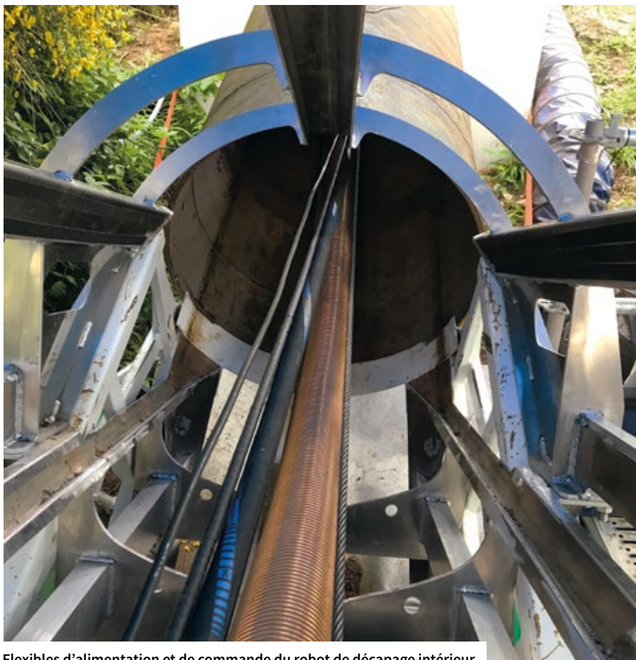
Flexibles d'alimentation et de commande du robot de décapage intérieur