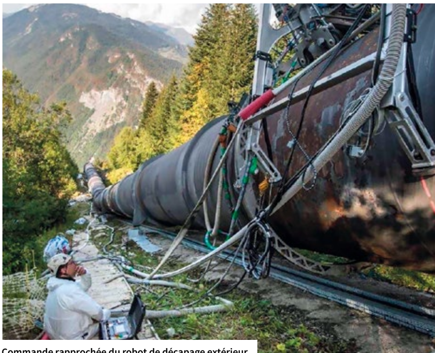
Commande rapprochée du robot de décapage extérieur