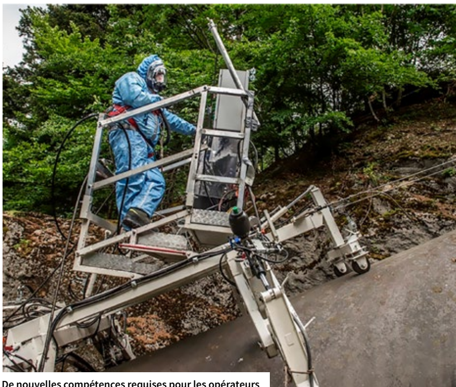
De nouvelles compétences requises pour les opérateurs

Pour La Coche, concernant la surface extérieure d'une conduite, des solutions alternatives, c'est-à-dire sans échafaudage et sans confinement, étaient déjà en cours de réflexion depuis 2012 en collaboration avec des structures comme la CARSAT, la DREAL, l'OPPBTB et le CEREMA. C'est bien dans le but de ce chantier, effectué en 2018, qu'EDF avait réalisé, trois ans plus tôt, un prototype de support d'outil se déplaçant sur la conduite. Deux robots ont été élaborés, et mis en œuvre dans un contexte de co-activité avec les autres opérations sur La Coche. Le premier est un outil de lavage muni d'une pompe placée en amont, près du treuil et d'une buse de lavage tournante ou fixe, de hauteur réglable, couplée avec une brosse rotative et une boîte de captation et de filtration de l'eau. Ce robot est muni d'un dispositif de sécurité (palpeurs bloquant la translation en cas d'obstacles) et d'un anémomètre arrêtant le chantier en cas de vent.